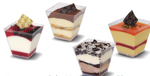
Unsere genüssliche Mini Cube Auswahl

Minipatisserie 2-3 Stück pro Gast, Mindestbestellmenge pro Sorte 10 Stück